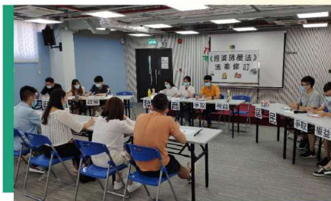
學員針對時政議題，分組進行4D角色辯論