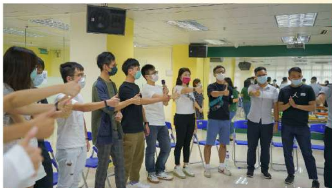
學員在座談會後進行聯誼活動，增進友誼